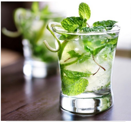
夏のカクテル「モヒート」

フレッシュミントの注文は通年で受けていますが、七月からは注文量が増えています。ミントの注文をしてくださるのは、高松中央市場と高松市内の八百屋さんとSB食品さんと高松市内の飲食店さん数店舗です。このミントの使い道は、料理やデザートなどの飾りつけやカクテルの「モヒート」などの冷たい飲み物に使われます。