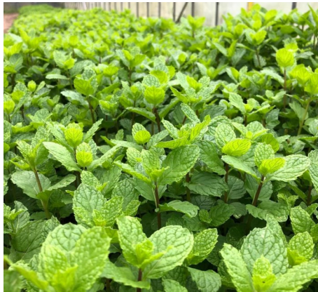
元気に育つハウスミント

ミントは路地栽培とビニールハウスで栽培しています。ハウス内で育つミントは葉が虫に食べられることなく綺麗に育ちます。路地栽培はハウスに比べ幹がしっかりとし、香りが強いです。同じミントですが栽培環境が違いうだけで生育具合が異なります。