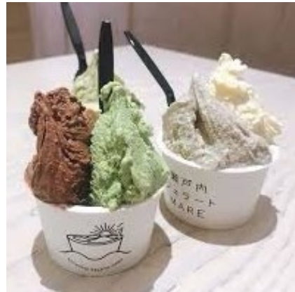
ミントを使ったジェラート

高松市商店街にあるジェラート屋さんではフレッシュミントをすり潰してレモンと柚子を合わせた「ミント柚子レモン」が人気のように大量に注文をくださいます。