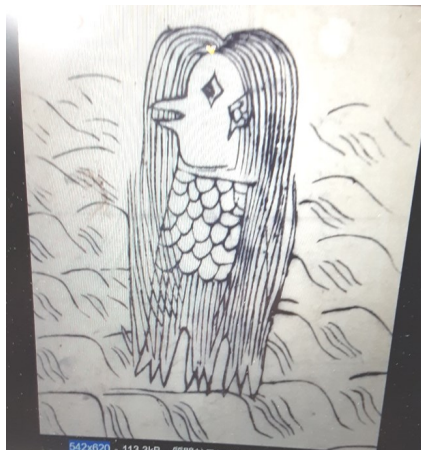
— 予言獣アマビエ —

慎みまして新型コロナウイルスの感染被害と併せて熊本豪雨激甚災害及び全国被災地の皆様にお見舞い申し上げます。