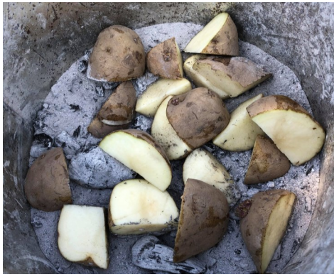
切り口に灰を付ける

大きい種イモ（植え付けるジャガイモの事）は、芽出し後、大きさに応じて切ります。切り方は、一片が平均40g程度になるように、芽が出ている場所を残して縦に切ります。切った種イモは切り口から腐るのを防ぐため、切り口に草木灰を付けます。