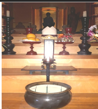
— 祈禱すれば必ず感応の蒙る —

二〇一九年五月一日より新たな「令和」と言う世紀に入って約一年が経過しました。 阪神大震災に次いで東北での大震災・津波・原発事故等の複合大惨事の復興もまだ道半ばにして、中国武漢が発生源と言われている世界的な新型コロナウイルスが世界を席卷しています。 人間の叡智は月や火星にまで及んではいますが、身近にして我が足元に忍び寄る肉眼で察知出来ないウイルスに翻弄されています。 今回のウイルス問題は如実に「世界はひとつ！」を実証していると思えます。 各国ともに「我が国」のみの対応では解決不可能だと実感されたこと