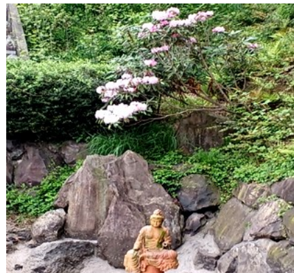
— 楚楚と咲いて皐月の入り —

先月の四月十八日未明、急にスマホが「地震です・地震です」と連呼しました。殆んど地震の体感もないので眠りに付きましたが、翌朝のニュースで四国四県を中心に震度六〜三程度の地震があり、特に高知・徳島では人的被害も含めて家屋の被害が報告されています。 本年一月一日夕刻には能登地方の大津波と震度七という大地震で甚大な人的物的被害があっただけに「南海トラフ大地震は三〇年以内に必ず起こる」と言われていて、各自治体や学校関係でも地震を想定した避難訓練が行われています。 それでも「地震など起きない」と無関心な方達もいらっしやいます。