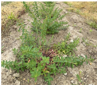
セントジョーンズワート

昨年に定植したセントジョーンズワートは三月上旬までは小さな苗でしたが、四月に入ってから横にも上にも伸びて大きく育っています。収穫は夏至の六月二十一日前後と言われており、後一ヶ月半で大株に育ち黄色く可愛らしい花を咲かせてくれます。今から楽しみです。