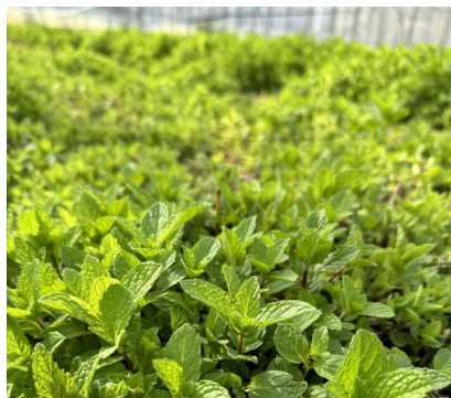
元気に育つミント

たカモミールは二十五日に初収穫を行いました。五月に入ると二日に一回のペースで収穫しないといけないぐらい満開になります。カモミールは現在在庫を切りましており、収穫し乾燥出来たら直ぐに送って欲しいとご予約されているお客様も数名いらっしゃいます。カモミールは香りが良く、見た目も可愛い人気のハーブです。また、ビニールハウスで育てているスペアミントも急成長しています。ハウスは露地よりも気温が高い分成長も早いようで、グングンと伸びています。