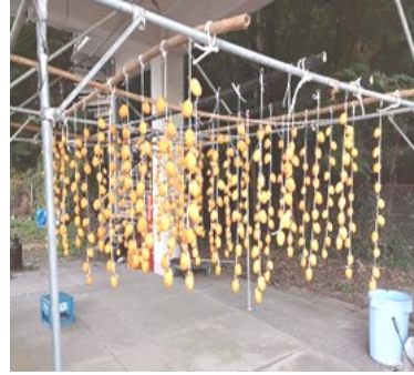
— 渋柿 —