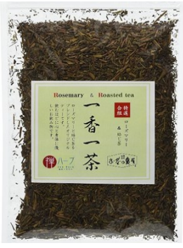
いっこういっちゃ 一番一茶 80g ¥1,459 ※Amazon側より売上 状況により価格変動有

21 7 圓通寺「定例坐禅会」 社会福祉法人「四恩の里」 評議員会 於 圓通寺 20 若竹学園生徒参拝 21 圓通寺「定例坐禅会」 22 社会福祉法人「四恩の里」施設 管理者会議 於 亀山学園