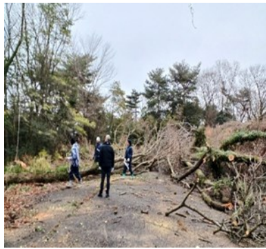
— 伐採風景 —

村の運営には当然資金が必要ですので、今後中心になって活動してくれる人の人件費として、クヌギ自体は薪用として椎茸と共に販売を考えています。