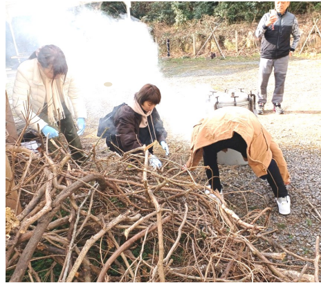
— 非常時の炊飯に薪を活用 —

改めまして能登半島を襲った津波と大地震で尊い命を失くされたり、家屋等甚大な被害を被られた方々に心よりお見舞いを申し上げます。