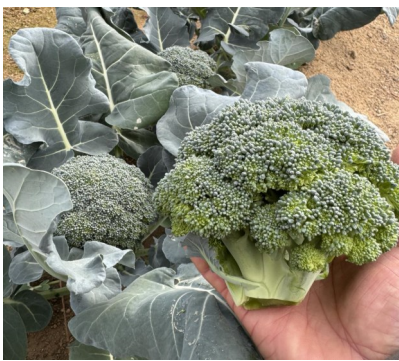
立派に育ったブロッコリー

昨秋に苗を植えて育てている冬野菜が収穫時期を迎えました。今冬は路地ではなくビニールハウスでキャベツ・ブロッコリー・水菜・レタス等を育てています。ビニールハウスで栽培しているので霜で傷むことなく元気に育ってくれています。キャベツはもう少しで大玉に成長しますが、ブロッコリーは食べ頃サイズになりました。水菜も大株に成長しています。