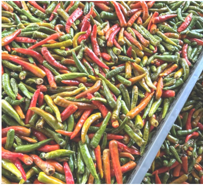
収穫を終えた香川本鷹

しかし、いくら暖冬といっても一回でも寒波が来ると唐辛子は凍傷で傷んでしまいます。十二月と一月の寒波で畑に残っていた唐辛子の四分の一位を駄目にしてしまいました。とても勿体ない事をしてしまったと悔やんでおります。傷んでいない唐辛子だけを最終収穫し乾燥を終えました。