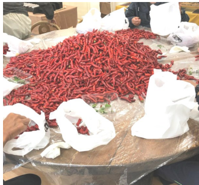
選別中の赤唐辛子

乾燥後に選別を行い、赤一味用の粉末唐辛子と青一味用の粉末唐辛子、ホールで販売用の形状の良い唐辛子、少し傷の入っている業務用の唐辛子に分別します。