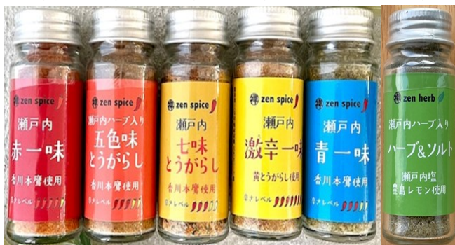
①②③④⑤ 各540円(税込) ⑥ 378円(税込)