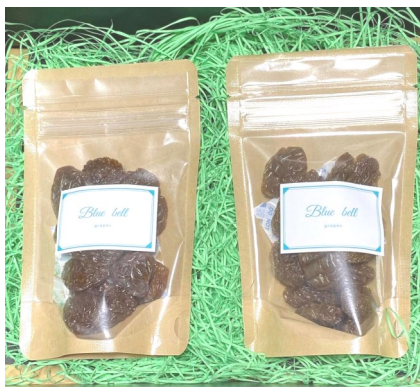
完成した乾燥マスカット

試作乾燥したサンプルを気に入ってもらえたので8月上旬に計60kgのマスカットの加工依頼を受けました。乾燥加工からパック詰めまで塾生の皆と行いました。