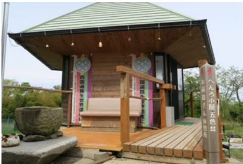
— 遍路小屋(無料宿泊所) —