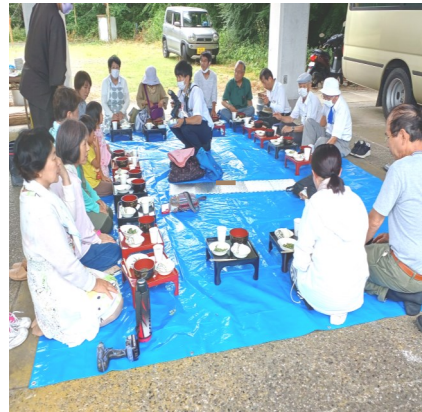
— 薪でご飯を炊き、 野草の天ぷら —