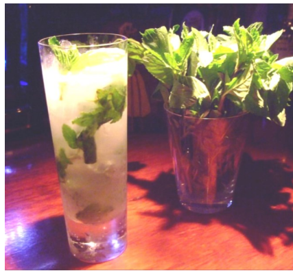
イエルバブエナのモヒート

一つにイエルバブエナがあります。イエルバブエナは初めて聞く方もいらっしゃると思いますが、別名として「キューバミント」「モヒートミント」と呼ばれています。夏のカクテルと言えば「モヒート」ですが、五色台ハーブ園でもモヒート用にミントの注文が増えています。