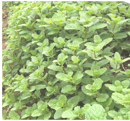
元気に育つミント

今年の夏も炎天下が続きました。塾生も植物もバテバテでしたが、こんな暑い夏に最も需要があるのが『ミント』です。ミントの成分には冷感作用があり、日本環境アロマ協会の実験では、ミントの香りで体感温度が4℃も下がり、暑さへの不快感が軽減したというデータもあるそうです。