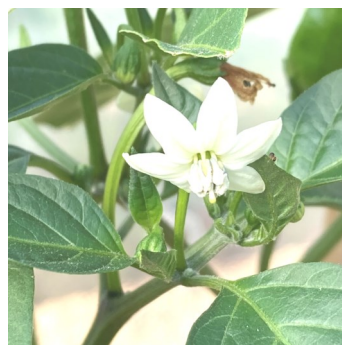
— 香川本鷹の花 —

J A香川県さんと農福連携の協体制度も少しずつ進んでいます。働きづらさを抱えた方を受け入れてくれる、或いは応援してくれる農家さんを募集しています。ご連絡いただきましたら、お伺いしてご説明させていただきます。お気軽にお問い合わせください。