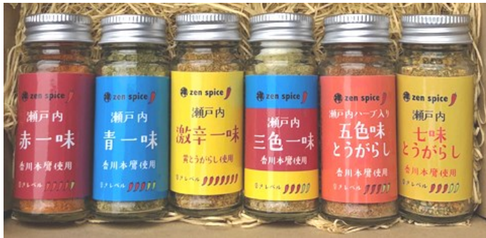
① 赤一味 ② 青一味 ③ 激辛一味 ④ 三色一味 ⑤ 五色味とうがらし ⑥ 七味とうがらし 各540円(税込)

31 20 19 6 1 若竹学園生定例参禅 圓通寺「定例坐禅会」 サヌカイトの里定例会議 於 ゼルコバ 圓通寺「定例坐禅会」 白百合女子大学坂本教授他来山