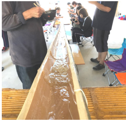
風情ある流しそうめん

竹林から竹を切り出して手作りした流しそうめん台で食べるそうめんは普段室内で食べるよりも一段と美味しく、皆さん沢山食べていました。足らずに追加で茹でてでも足りないぐらいの人気で、大盛況でした。