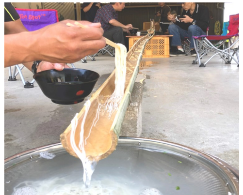
つつい食べ過ぎてしまいます

竹林から竹を切り出して手作りした流しそうめん台で食べるそうめんは普段室内で食べるよりも一段と美味しく、皆さん沢山食べていました。足らずに追加で茹でてでも足りないぐらいの人気で、大盛況でした。