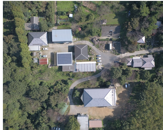
— 令和を迎える喝破道場空撮 —

平成天皇のご退位により、新たな元号が「令和」と決定された。新たな元号と相応しくないとする方々が夫々にコメントを出されているようですが、その元号に依って新たな時代の不幸が決定づけられる訳ではないと思います。 人は産まれ来る吾子のためにその一生が幸多かれと願い、中には易学や姓名判断を生業とする方に依頼して命名することもあります。 修行時代に法友が堂頭老師に自分の法名の手本書きをお願いしたこと