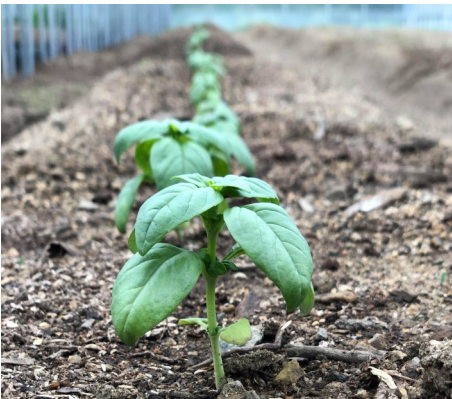
まだまだ小さいバジルの苗

新設したビニールハウスに畝を作って植え付けを行いました。まだまだ小さい苗ですが、六月には大きく成長し収穫時期を迎えます。