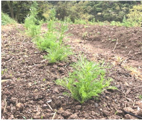
植え付けを終えたカモミール

カモミールはハーブ園の斜面で路地栽培ですが、三月四月と雨の日が続き、なかなか土が乾かなかつた為、畑を耕すことができませんでした。なんとか晴れの続いた十一日に遅れながらも植え付け作業をすることができました。植え付けた苗は、昨年育てたカモミールのこぼれ種から自生した苗を移植しました。