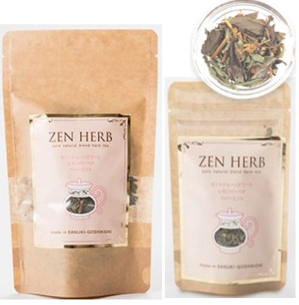
1000円 (2g×8包) 400円 (6g)

太陽のまつり セントジョーンズワート・レモンバーベナ・ペパーミントをブレンドした五色ハーブ園のオリジナルブレンドハーブティーです。ハッピーハーブをブレンドした可憐な風味です。元気を出したい時に。