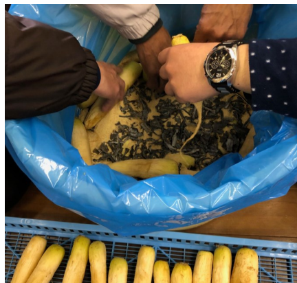
干した大根を敷き詰める

ブ園産の香川本鷹とうがらし」を使い漬け込みました。漬け方は、ぬかなどを混ぜ合わせた混合ぬかと、大根を交互に敷き詰めていきます。大根を桶の形に沿ってすき間なくきっちり敷き詰めていくことが重要です。最後に空気が入らないよう大根の葉でおおいます。重石を乗せれば半年後に食べられるようになります。