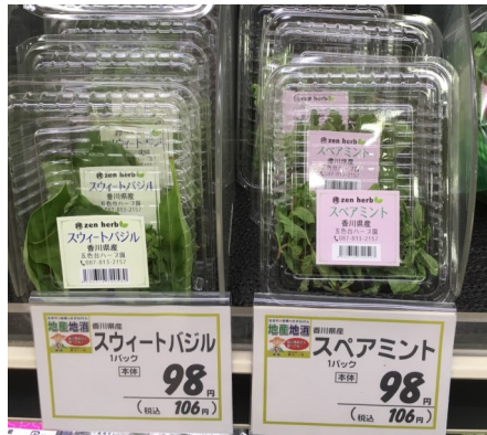
スーパー並ぶフレッシュハーブ

バジルは新設したビニールハウスで栽培します。順調に育てれば六月には収穫が始まる予定です。昨今需要のあるフレッシュミントとフレッシュバジル、そしてとうがらしがハーブ園の軸を担います。