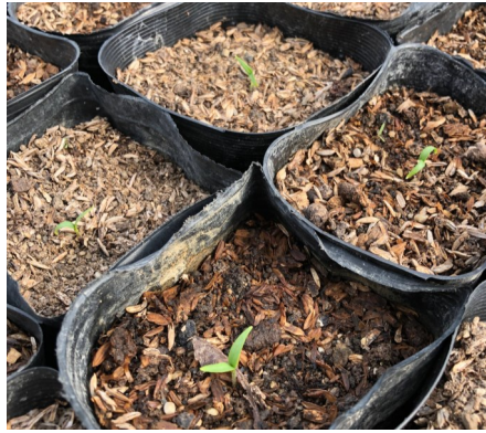
とうがらしが発芽

三月上旬に種を蒔いた香川本鷹とうがらしが順調に発芽しました。唐辛子の発芽条件は二五度から三十度の地温が必要ですが、暖冬の今年は期待も込めて早々に種を蒔いてビニールハウス内で管理しています。冷え込む時期もあり心配しましたが、しっかりと発芽してくれました。