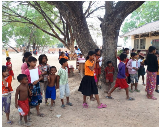
— カボジアの子ども達と学生ボランティア —

「少子高齢」と言われて久しいが、今に至ってボデイブローが効いて来たかのように国全体が大揺れしているようです。 人手不足・人材不足は企業のみならず、医療・教育・介護の分野にも及び、空回りと疲弊状態に陥っているように見えます。 足下の喝破道場に於いても往時は二〜三〇人居た塾生は今や四〜五人の状態、辛うじて禅道場の形態を維持しているのが実情です。 檀信徒・葬儀法要を営まない道場の将来はある程度見通せていたの