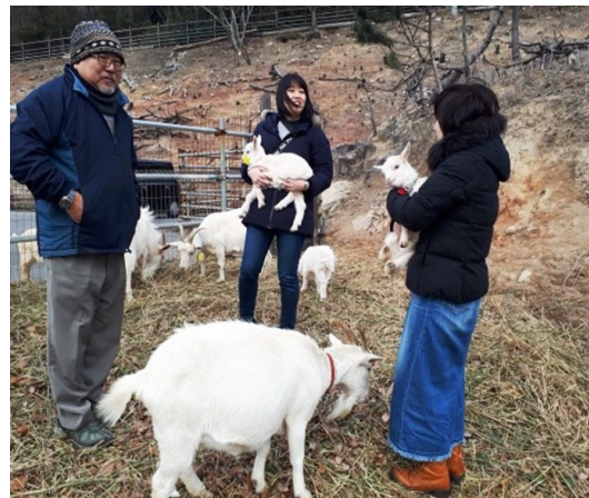
— ヤギも癒しの仲間入り —

時代の変化に伴い、環境に適応して様々な分野が形を変え姿を変えて栄枯盛衰しています。 国の要とも言える農業が母ちゃんや爺ちゃん婆ちゃんに託され、本来農業を担うべき若者や壮年者は給与の良い企業に勤めて農繁期のみ農業に従事していましたが、その農業自体に変化が生じてきているようです。 と言っても「少子高齢」は逃れようのない現実ですが、都会で働いていた若者たちが、従来の農業従事者とは異なった視点と発想で農業に参入して成果を上げています。