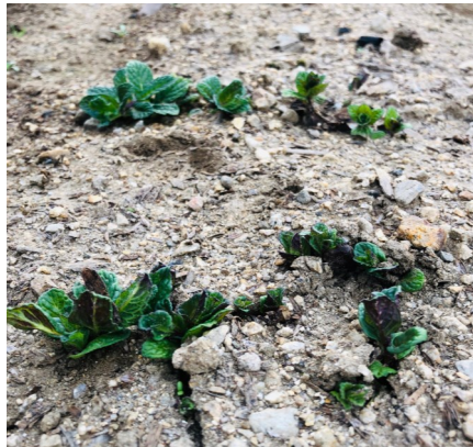
元気な芽を出すミント

育つミントは順調に成長しており、年間を通じて収穫ができています。これまでの路地栽培では冬になると葉が枯れてしまったので、ビニールハウスの偉大さを改めて感じました。新しいビニールハウスは二連棟で設置しており、一棟はミント栽培用で、もう一棟はバジルの栽培用です。一昨年設置したビニールハウスで元気に育つミントを株分けし、新しいビニールハウスに移植しました。