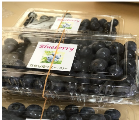
フレッシュなブルーベリー

力を向上させてくれます。テレビやゲーム、スマートフォンの画面を長時間見続けることは当然視力の悪化につながります。使用時間の制限はもちろんの事、ブルーベリーを食べれば視力回復も良いですね。