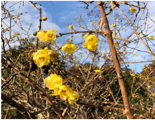
— 春を告げる蠟梅 —

22 圓通寺「定例坐禅会」 サヌカイトの里打ち合わせ会 24 於 圓通寺 29 農林水産政策研究所主宰「農福 連携シンポジウム」に参加 於 東京砂防会館 5 圓通寺定例坐禅会 6 四恩の里主催本部研修 8 四恩の里開設二十五周年記念 祝賀会 於 花樹海 19 圓通寺「定例坐禅会」 24 第四回一日一斉「おもてなし遍 路ウォーク」若竹学園生参加 (81番白峰寺↓82番根香寺)