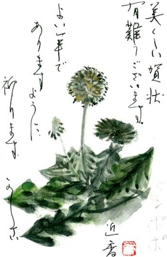
大阪市 山口 近香