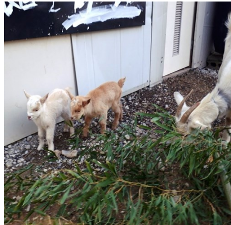
— <生老病死> 満月の朝に仔ヤギ2頭誕生 —