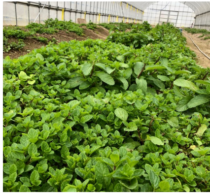
順調に育つミント

昨年の冬に設置したビニールハウス一号が大活躍しています。露地栽培のミントは、冬場に霜にあたると変色し枯れてしまいます。地上部が枯れてもまた春には芽吹きますが、冬場の収穫はできず、フレッシュミントの注文があってもお断りしていました。しかし、今年の冬場はハウス内で栽培しているミントは霜にあたることなく元気に育っています。