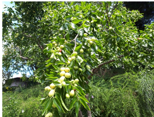
— 極暑に耐えてナツメの深き味 —

越後の良寛さん、として親しまれた大愚良寛和尚は備前玉島の圓通寺で厳しい修行を了えて故郷に帰られ、子供たちと終日戯れて過ごした、と言われています。