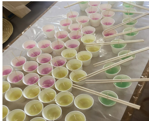
かわいいキャンドルが完成

セットしておきます。紙コップに色と香りの付いたろうソクを注ぎ込みます。二〜三時間でろうソクが固まります。固まったら割り箸と紙コップを取り出します。はさみで芯を約一センチ残して切り取ったら完成です。色鮮やかな四種類のキャンドルができました。