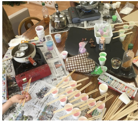
キャンドル作りに挑戦

作ったキャンドルはレモン・グラス・ローズマリー・ラベンダー・ペパーミントの四種類です。作り方は簡単で、ろうソクを湯せんで溶かします。溶けたろうソクにクレヨンとエッセンシャルオイルを混ぜて色と香りをつけます。紙コップの中心にろうソクの芯を割り箸で固定して