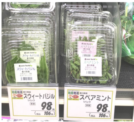
コープに並ぶミントとバジル

今年からコープがわさんとも取引が決まりました。生鮮の棚にはハーブ園のミントとバジルが陳列されています。