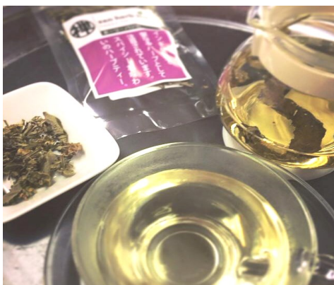
ホーリーバジルティー

「ハーブの王様」とも呼ばれるバジルの魅力は、さわやかで強い芳香です。原産国はインド。ヒンズー教徒のあいだでは、バジルは神に捧げる高貴な植物とされ、幸福を願って家や寺院のまわりに植えられてきました。