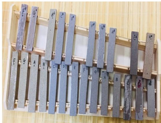
― サヌカイト原石から陶琴誕生 ―

慎みまして西日本大水害で被災又は故人となられました方々に心よりのお見舞いと哀悼の意を表します。