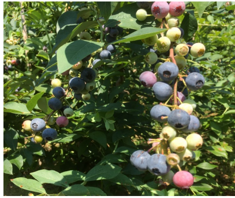
大粒のブルーベリー

七月からブルーベリーの収穫が始まりました。一昨年頃から収量も増え出し、今年も豊作です。一粒一粒が例年より大きく実っています。