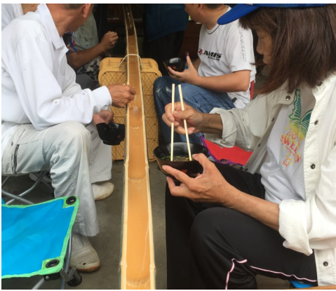
早く流れてこないかなあ

四月から実施してきた高松市の委託事業である就労準備支援事業は、七月十二日をもって前期の活動が終了しました。また、善通寺市から委託を受けている就労準備支援事業は六月末で前期事業を終えました。今期も多くの方が参加してください、様々な活動を通じて就労に向けた一歩が踏み出せたと思います。特に七月は炎天下が続き、暑い中でも精一杯活動してくださりました。最終日の十二日は、暑い夏を吹き飛ばす「流しそうめん」で締めくくりました。