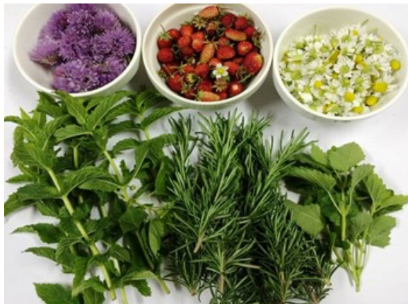
— 今が旬 ハーブ園のハーブ達 —