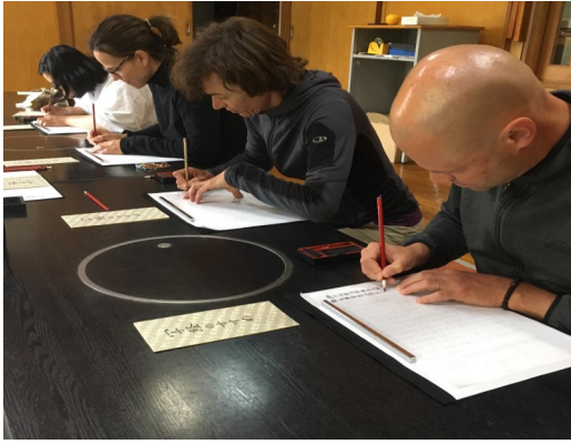
— 写経にいそしむ (右端) —

喝破道場に滞在して受けた印象をお伝えする前に、何よりもまず、皆様への親切と歓待に対し、お一人お一人に、心より感謝いたします。