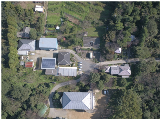
— 空から見る喝破道場の全景 —