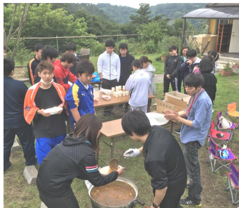
協力してカレー作り

同期の皆と協力して作るカレーは、自分でやらなければならぬ事を自分で探し、人の為に動くのは意外にも難しく、役割分担の大切さを学べます。また、普段見られない同期の動きに、新しい発見や感銘を受けることもあります。この研修を通じて同期の絆がより強くなった事でしょう。社会人として大きな一歩を踏み出すお手伝いができ、嬉しく思います。