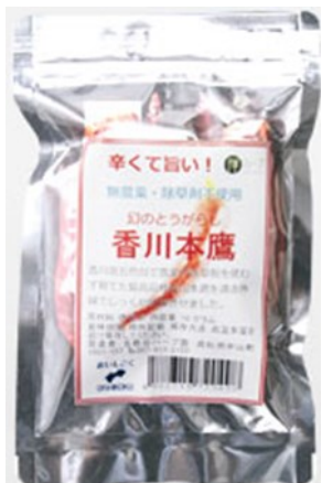
1袋 270円(内税) 内容量10g

E-mail kappa@kappa.or.jp Tel 007-882-4022