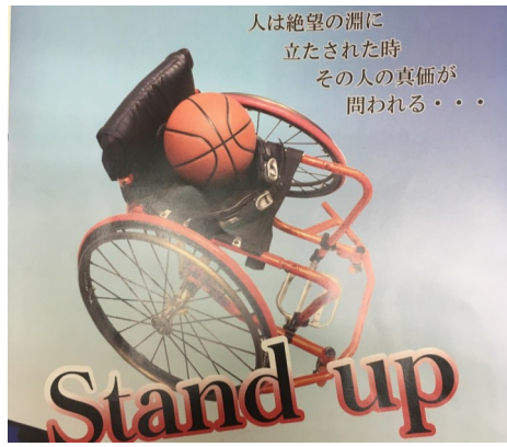
～あきらめない君へ～

毎年、株式会社タダノの会長さんから招待してくださる「すわらし劇園」を鑑賞しに五日の夜皆で行ってきました。今年は「Stand up」あきらめない君へ」という題材で、バスケ部員あきらが主人公の物語でした。