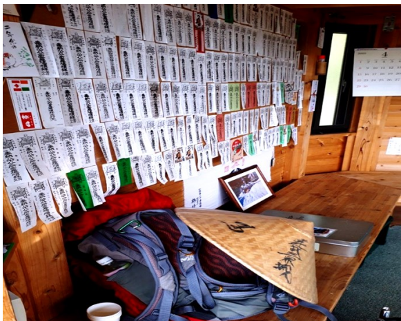
— 1200年来の路を辿る旅もある —

大阪北部地震により犠牲となられた方々にお悔やみを申し上げるとともに、被災されたすべての方々に心よりお見舞い申し上げます。