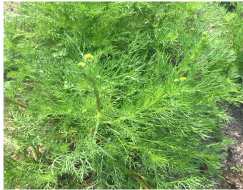
ハウスで元気に育つカモミール

を植える時期が来しました。例年育てている圃場は昨年からミントの栽培用にビニールハウスが設置されていますので、栽培場所をハーブ園の斜面三段の畑でカモミールを育てます。ビニールハウス内では、昨年育てたカモミールから開花の後に種を落とし、自然と発芽したカモミールが育っています。ハウス内が温暖なので生育も良く、早くも花を咲かせようとしているカモミールもあります。