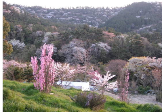
— 春爛漫 —