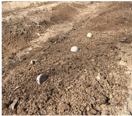
植え付け前のじゃがいも

七日にじゃがいもの植え付けを行いました。毎年、北海道や山口県等から沢山のじゃがいもをいただきます。毎食のように美味しく料理して食べていますが、時の経過と共にじゃがいもから芽が出てきました。植え付け時期とタイミングが合うので芽が出ているじゃがいもを種いもとして半分は切り、切った断面に木灰をつけて植え付けました。