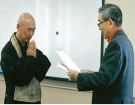
— 全国PHP友の会PHP 思いやり運動様よりご寄附 —