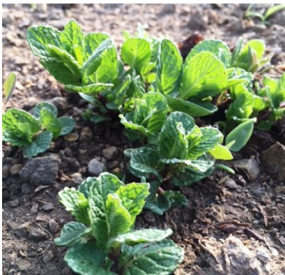
順調に育つミント

ビニールハウスのミントは順調に育っています。新葉が次々と芽吹いています。路地とは比べものにならない生育ぶりにハウスの凄さを実感しました。