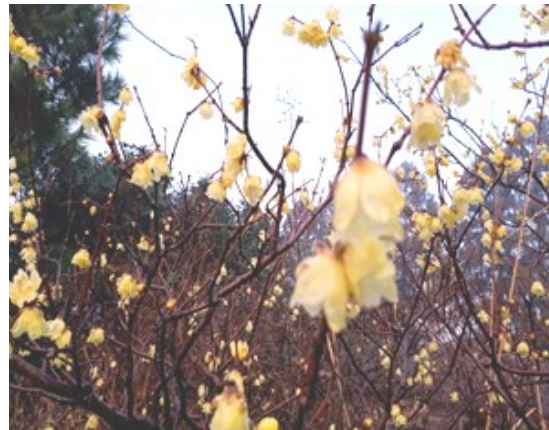
— 春の兆しの蟬梅 —

寒波での積雪ご被害に心よりお見舞い申し上げます。 世界各地で地震等の自然災害が頻発しています。 詩人の宮沢賢治の遺作メモと言われている「雨にも負けず」の詩の中で「寒さの夏はオロオロ歩き…」とありますが、自然災害の中での人間の無力さは誰も認めるところでしょうが、自分の無力さ故にもどかしさと不甲斐なさから、只々おろおろしながら周囲を気遣うしかできないことを悲しいと思うのは、決して