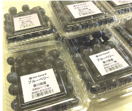
新鮮なブルーベリーを販売

商品にならないブルーベリーはジャムに加工して、パンを食べる毎週月曜日の昼食に皆で頂いています。