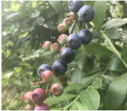
甘酸っぱいブルーベリー

早十五年目の苗木になるので収量も落ちていますが、未だに美味しそうな青い実をならしています。