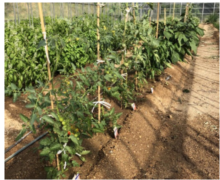
元気に育つ夏野菜たち

夏場のビニールハウスは気温が40℃以上になるので水を切らさないよう心掛けて栽培しています。