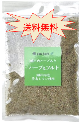
ハーブ&ソルト 80g ¥983