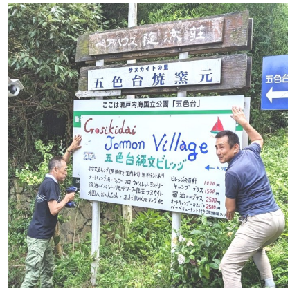
— 看板完成 —