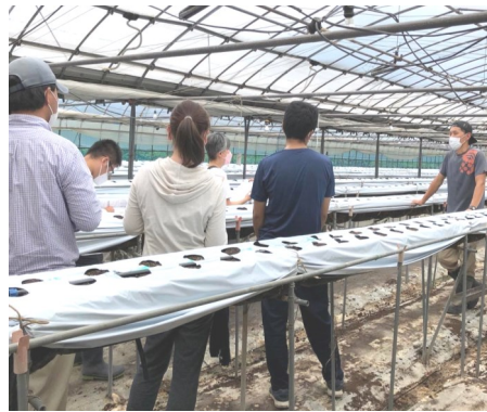
丁寧に説明してくださりました

メモを取っていました。将来イチゴ農家も有りかもと思った参加者もきつといたはずでです。