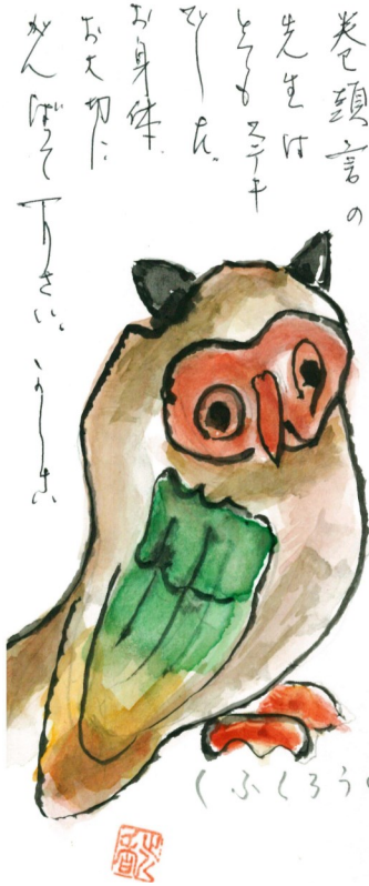
大阪市 山口 近香