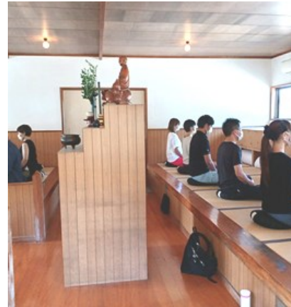
— 娑婆世界に心の安定を求めて —

慎みまして台風十四号で被害を受けられました皆様にご心よりお見舞いを申し上げます。