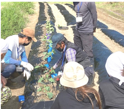
農家さんに教わる

また21日は、ブロッコリー農家さんを講師に招いて冬野菜の植え付け体験を行いました。ブロッコリーやキャベツ、レタスの苗を植え付け、大根、人参、ほうれん草の種を蒔きました。