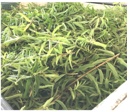
荷台いっぱい収穫できました

19日に今年二度目のレモンバーベナの収穫を行いました。レモンバーベナは、その名前から分かる通りレモンの香りのするクマツヅラ科の落葉低木のハーブです。収穫時も水洗い時も乾燥後に枝から葉だけをとり作業中もレモンに似た甘い香りを堪能しながら楽しく作業しました。