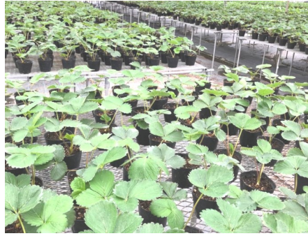
沢山のイチゴの苗

この時期のいちご農家さんは苗の定植前で育苗中でした。20aも面積に香川県のブランドいちご「さぬき姫」育てるそうです。9月中旬に植え付けを行い、収穫は12月末から始まるとの事でした。