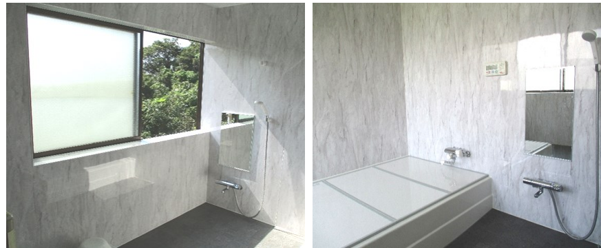
窓の外は森林の風景

皆様方のご支援のおかげで、立派な洗濯場と浴室ができました。心より御礼申し上げます。塾生及びお遍路様には、快適にお過ごししていただけるものと思います。