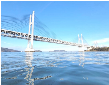
大迫力の瀬戸大橋

二十二日は寒さ厳しいなか、塾生の皆と船釣りに行ってきました。どうしても鯛を釣りたい！新年からおめでたい鯛が釣りたい！と言うことで、気温は0から2度位と極寒のなか瀬戸大橋周辺まで船を走らせました。