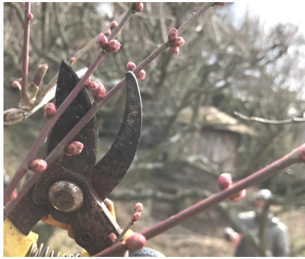
寒いなか外で作業

この剪定作業次第で収穫量が決まると言っても過言でない位大切な作業です。剪定ハサミで新しく伸びた枝を切っていきます。