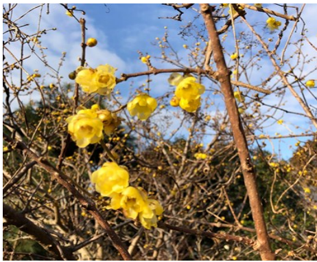
— 春を告げる蠟梅 —