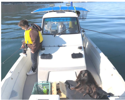
一同アタリを待つ

しかし、ヒラメにも相手にしてもらえずなかなか釣れません。終盤にGさんにヒラメにアタリがありました。皆の期待が膨らみましたが、そのアタリは最初で最後となり何も釣れないまま終わってしまいました。