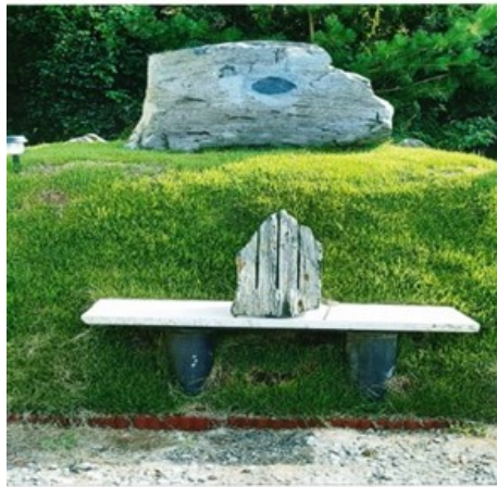
― 2022年サヌカイト元年 ―

慎みまして令和四年元旦の祝賀を 申し述べます。 旧年中は公私共に喝破道場、そして 四恩の里の児童施設入所児童並びに 職員に対しまして、ご支援を賜りまし たことを心より御礼申し上げます。